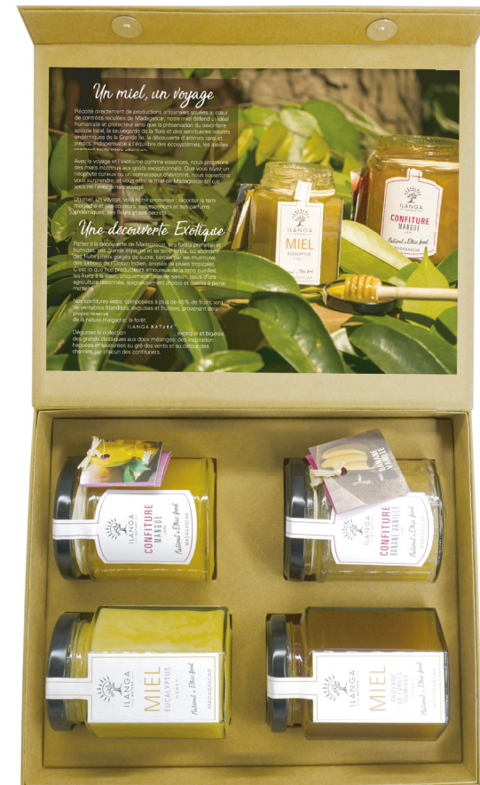
Assortiment de 2 miels 250g et 2 confitures 220g 143 000 Ar TTC