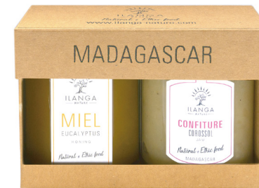
Duo mixte miel 250g confiture 220g 60 000 Ar TTC