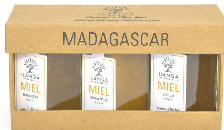
Trio de miels 140g 63 000 Ar TTC