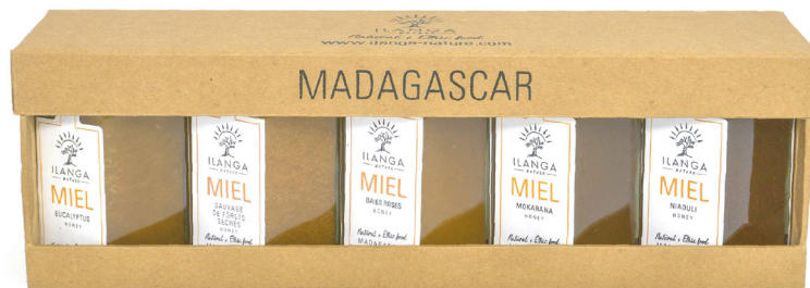
Quintet de miels 140g 105 000 ar ttc