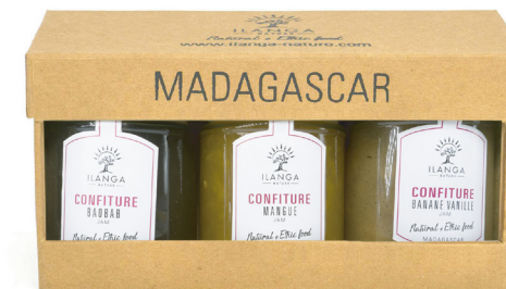
Trio de confitures 220g 85 000 Ar TTC