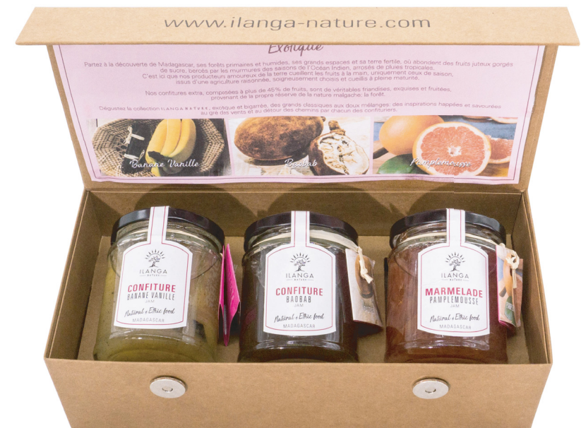
La Collection de 3 Confitures 220g 113 000 Ar TTC