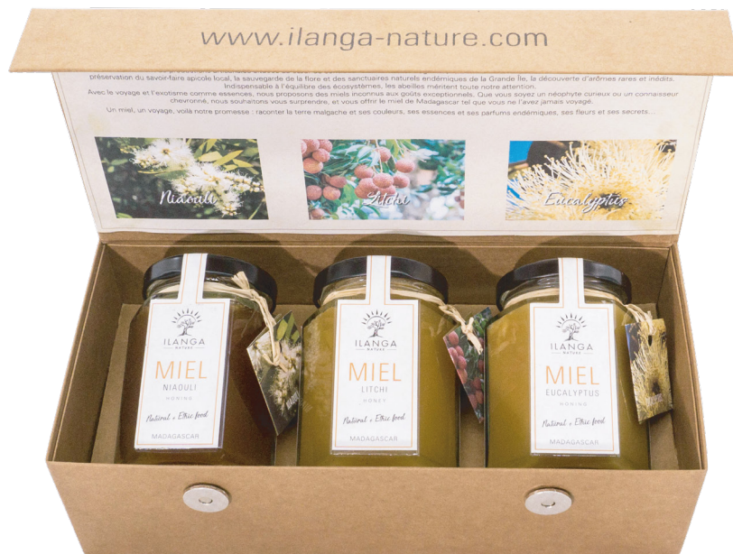
La collection de 3 miels 250g 113 000 ar ttc