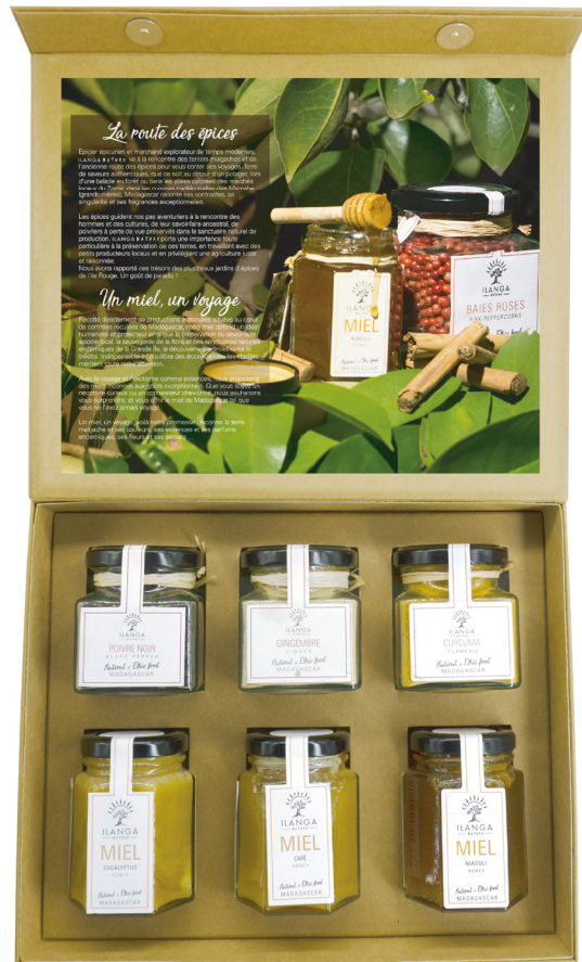
Assortiment de 3 épices découverte et 3 miels 140g 151 000 Ar TTC